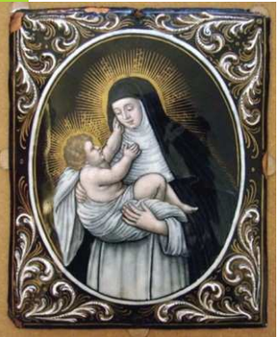
Saint Dominique au pied de la Croix, Fra Angelico