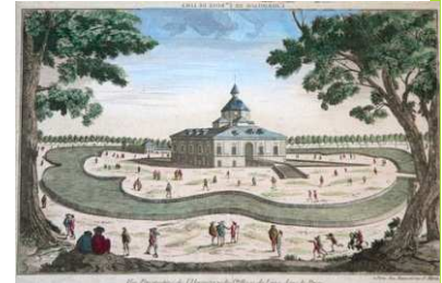
La basilique construite sur l'ermitage de Sainte-Rose de Lima