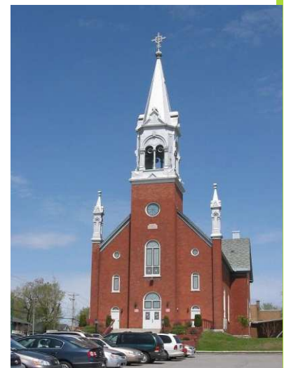
Paroisse Sainte-Rose-de-Lima, Gatineau, diocèse d'Ottawa.