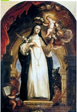
Saint Dominique, de Claudio Coello, musée du Prado, Madrid